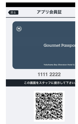
グルメパスポート会員証イメージ