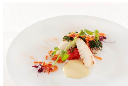
魚料理 「真鯛に分葱と桜海老をのせて」 (イメージ)