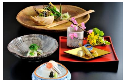
「会席料理プラン」※イメージ