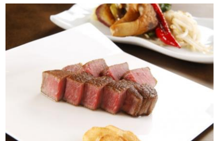
「極上“神戸ビーフ”ロース 淡路島の藻塩添え」