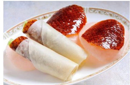
「こだわり窯焼き北京ダック」

■料金：大人 ¥6,930 お子様（4～12歳）¥3,410 ※サービス料込、税金別