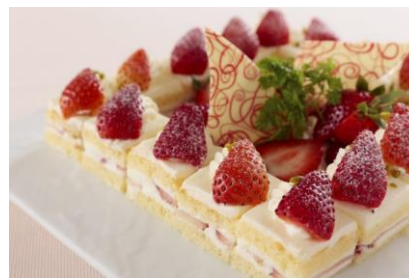
「いちごのショートケーキ」