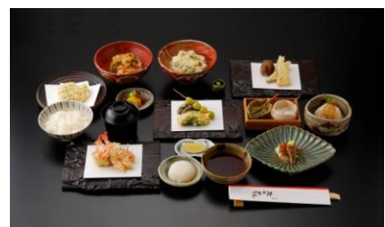
「天ぷらコース」※イメージ