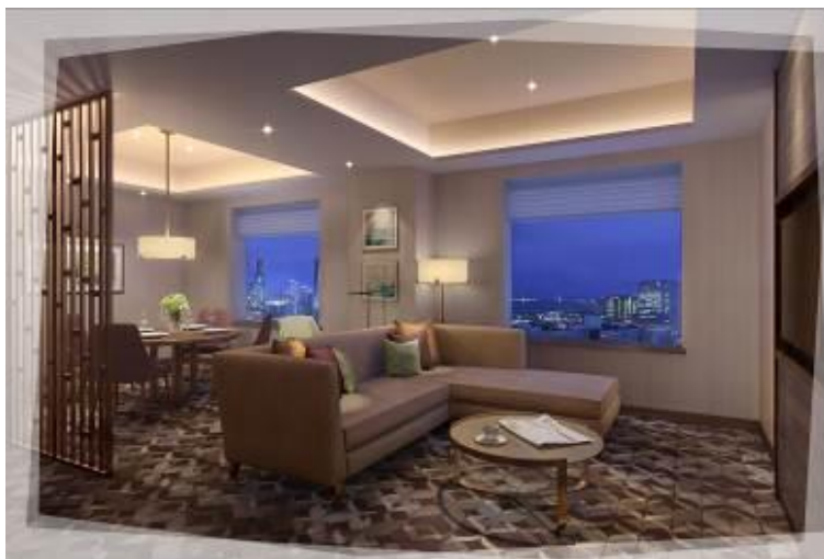
シェラトンクラブ(24F～27F) スイートルーム (71㎡) 完成予定図