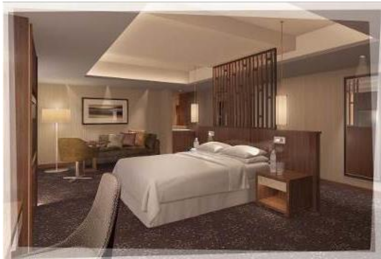
シェラトンクラブ(24F～27F) キングベッドルーム (50㎡) 完成予定図