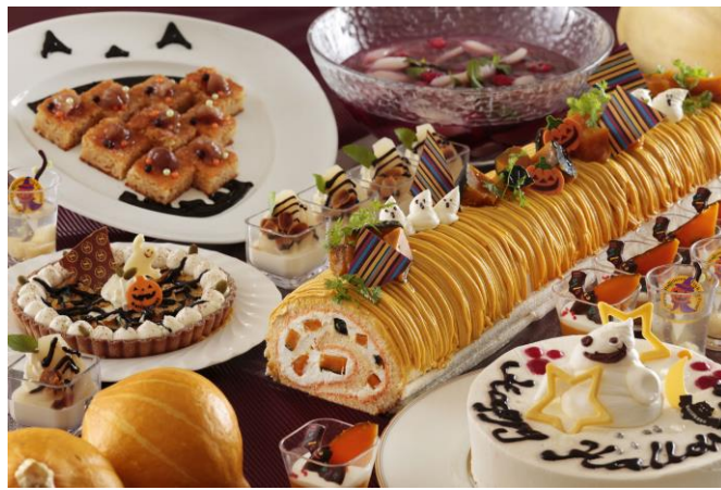
『ナイトスイーツbuffet「Sweets Parade」～Happy Halloween～』 (イメージ)

*1: ナイトタイムのスイーツbuffet「Sweets Parade」は、週末にあたる木・金の 18:30～ロビーラウンジ「シーウインド」で開催しているスイーツの食べ放題プランです。