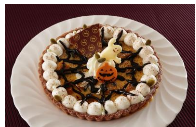
「かぼちゃフラン」 (イメージ)