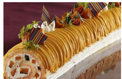
「ビッグパンプキンロール」 (イメージ)