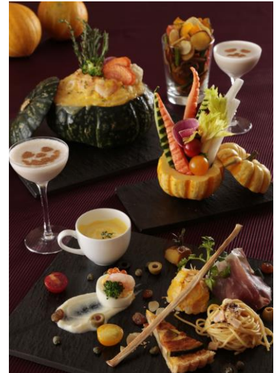
「ハロウィン デライトアワー」イメージ