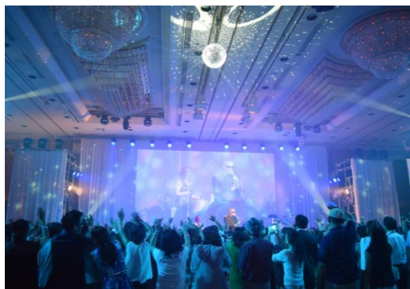
Summer Disco Night 2015 開催の様子