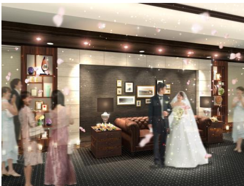
高砂エリアイメージ

「浜風」は、シックな色合いが華やかな中に落ち着きを醸し出すイメージを持ち、披露宴や企業様のセミナーやパーティーなどのご利用も多い宴会場です。また、館内に出雲大社の御霊を祀る神殿を併設していることから、近年人気の和装婚でのご利用も多くお見かけします。この度のリニューアルに伴い、“和”を基調にホテルとしての利便性とプライベート空間としての魅力を併せ、ウエディングシーンを中心に新たな出会いとおもてなしを演出いたします。