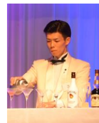
「ベイ・ビュー」バーテンダー (イメージ)