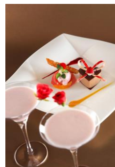
「ベイ・ビュー」オリジナル バレンタインカクテル (イメージ)