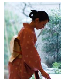
日本料理のテーブルマナー (イメージ)