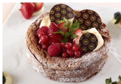
「チョコレートケーキ 赤い果実、 あまおうと共に」②