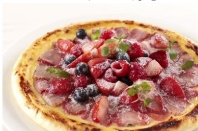
「あまおうとマスカルポーネのピザ」③