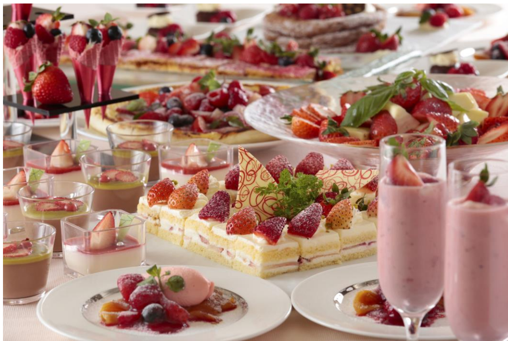
「アフタヌーンスイーツブッフェ ～Strawberry Fair～」 (イメージ)