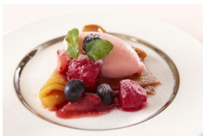
「クレープシュゼット ストロベリー アイスとあまおうのマリネ」①